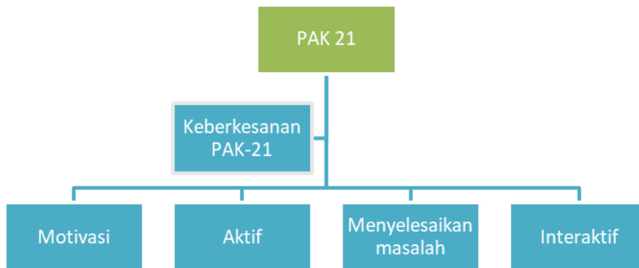
Rajah 1. Keberkesanan PAK-21.

Secara keseluruhannya, keberkesanan kaedah PAK-21 dalam pengajaran Pendidikan Islam amat jelas dan signifikan. Ia bukan sahaja meningkatkan penglibatan dan motivasi pelajar, tetapi juga memperkukuh pemahaman konsep dan pembangunan KBAT. Kaedah ini menjadikan proses pembelajaran lebih menyeronokkan, relevan dan bermakna, serta membantu membentuk murid yang bukan sahaja cemerlang dari segi akademik, tetapi juga mempunyai sahsiah yang baik dan mampu menyumbang kepada masyarakat. Dalam era pendidikan moden yang menuntut murid menjadi lebih berdikari, kreatif dan berfikiran terbuka, kaedah PAK-21 dilihat sebagai pendekatan yang sesuai dan berkesan untuk mendidik generasi masa depan yang berilmu dan berakhlak mulia ( Rajah 1 ).